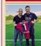
Pozzocco in visita È per l'Euroleague 5.000 euroressore